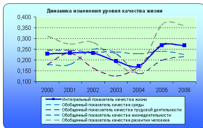
Рис. 2. Динамика изменения интегрального показателя качества жизни в зависимости от обобщенных показателей

В Абанском районе в период с 2002 по 2006 гг. качество среды ухудшилось на 10,36%, позиция района попадет в категорию территорий с отрицательной динамикой изменения уровня качества жизни (см. рис. 2).