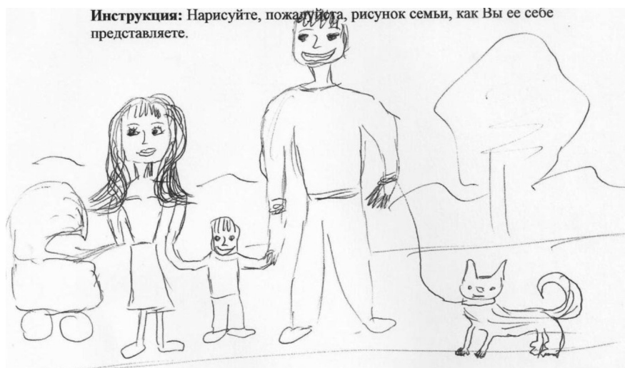
Рис. 2. Изображение главенства в семье