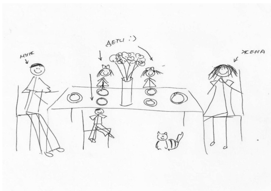
Рис. 4. Изображение семьи за столом

Изолированность изображения семьи от остального пространства листа: на нескольких рисунках китайцев и русских семья заключена в рамку, что говорит о замкнутой жизни, изолированность от социального окружения.