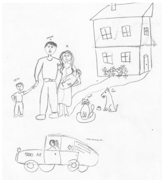
Рис. 3. Детальное изображение дома

Отношения «выше/ниже», по росту или местоположению: у всех респондентов изображены родители и дети, последние по росту располагаются ниже относительно первых. Данное расположение говорит о подчинении детей родителям. При этом муж и жена располагаются на одной линии, что показывает равноправие в семье.