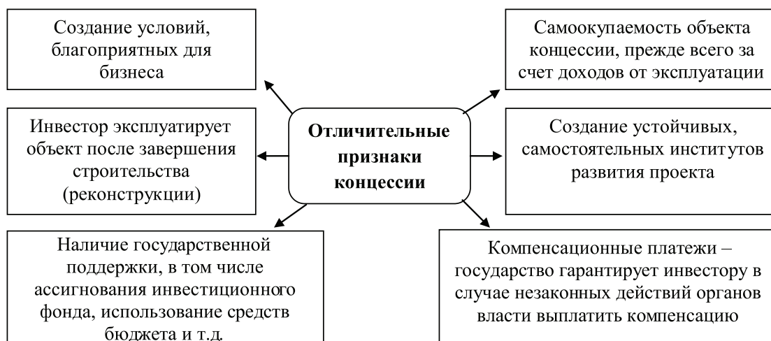
Рис. 1. Отличительные признаки концессионного механизма

По словам председателя Подкомитета по развитию ГЧП Комитета Государственной Думы РФ по экономической политике и предпринимательству Х.М. Салихова, основная идея законодательных инициатив – упрощение процедуры заключения концессионных соглашений в сфере деятельности организаций коммунального комплекса. Для этого предполагается внести следующие поправки в закон о концессиях (рис. 2).