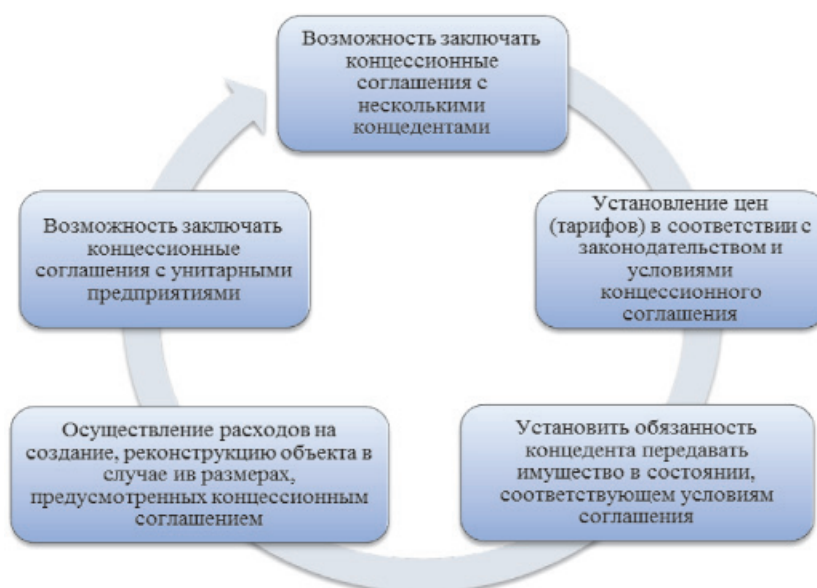
Рис. 2. Предполагаемые поправки к закону № 115-ФЗ «О концессионных соглашениях»