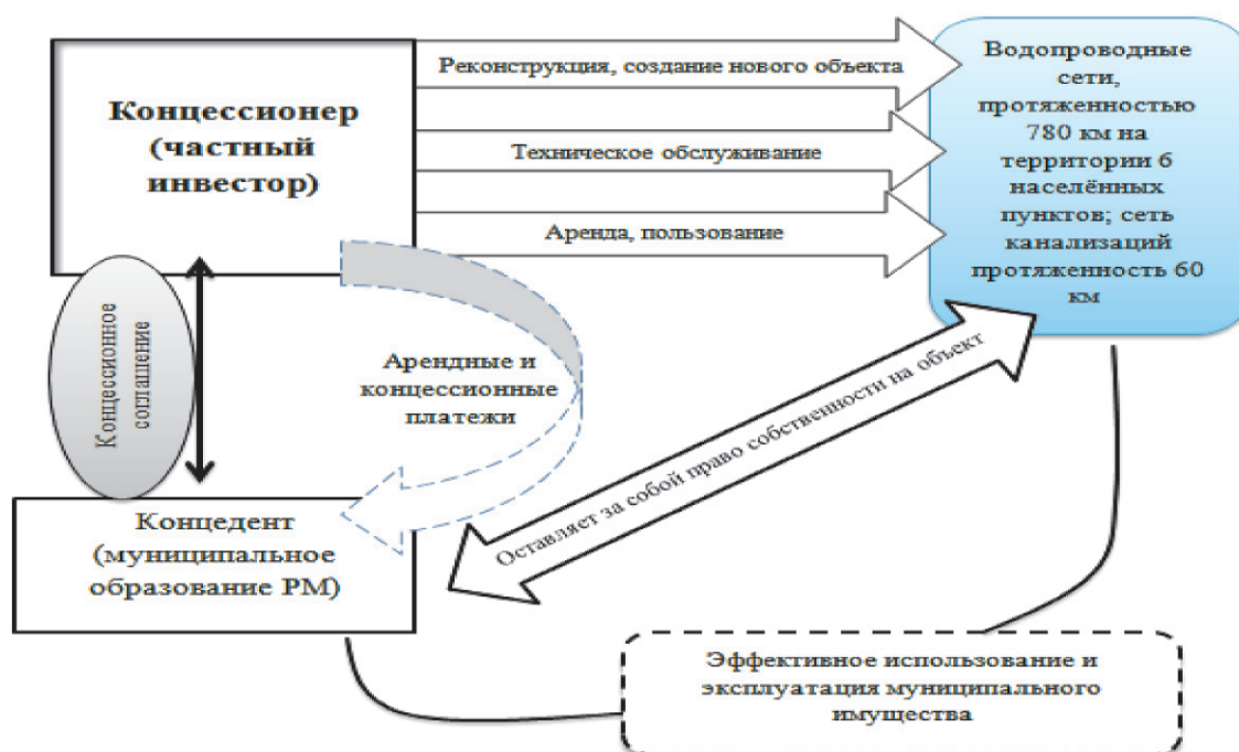
Рис. 4. Модель концессионного проекта в сфере водоснабжения и водоотведения в Республике Мордовия

Ключевыми факторами, влияющими на успешность применения концессионных соглашений в региональной практике, являются: – наличие нормативно-правовой базы; – наличие в регионе специализированных государственных органов или структур, обладающих необходимыми компетенциями и полномочиями по сопровождению проектов ГЧП;