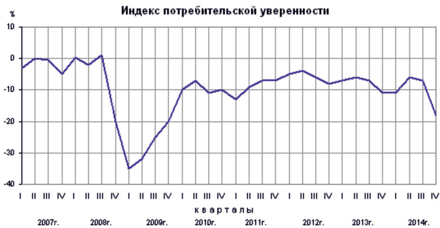
Рис. 2. Индекс потребительской уверенности