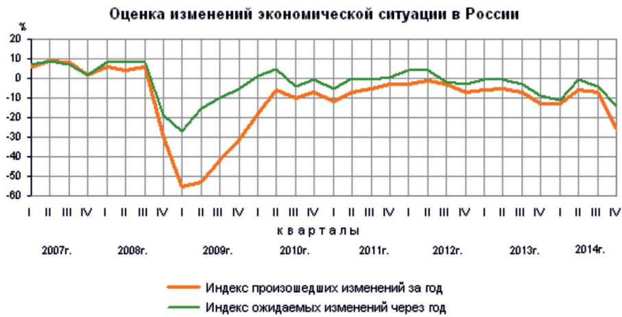
Рис. 3. Изменение экономической ситуации в РФ