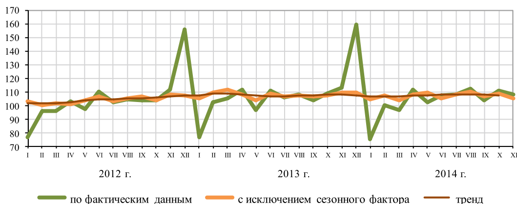
Рис. 1. Реальные располагаемые денежные доходы населения