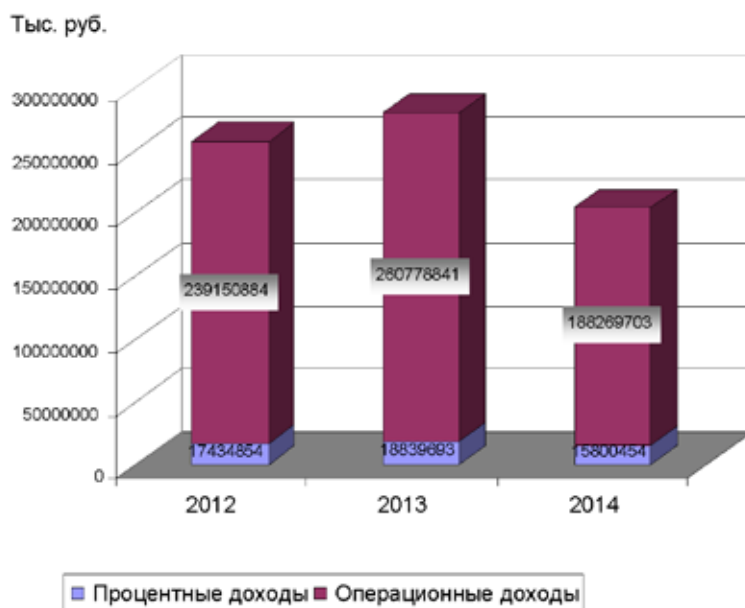
Рис. 1. Динамика изменения процентных и операционных доходов ПАО Росбанк на рынке иностранного капитала в 2012-2014 гг.

Наибольший удельный вес в общей структуре процентных доходов приходится на доходы от купли-продажи иностранной валюты в наличной и безналичной формах, на второй позиции – кредиты, предоставленные юридическим лицам-нерезидентам; на третьей позиции – кредиты, предоставленные банкам-нерезидентам.