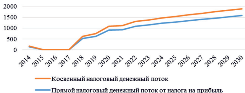
Рис. 2. Динамика прогнозируемых налоговых поступлений в бюджет от ИЗ «Приморье», млн. руб.