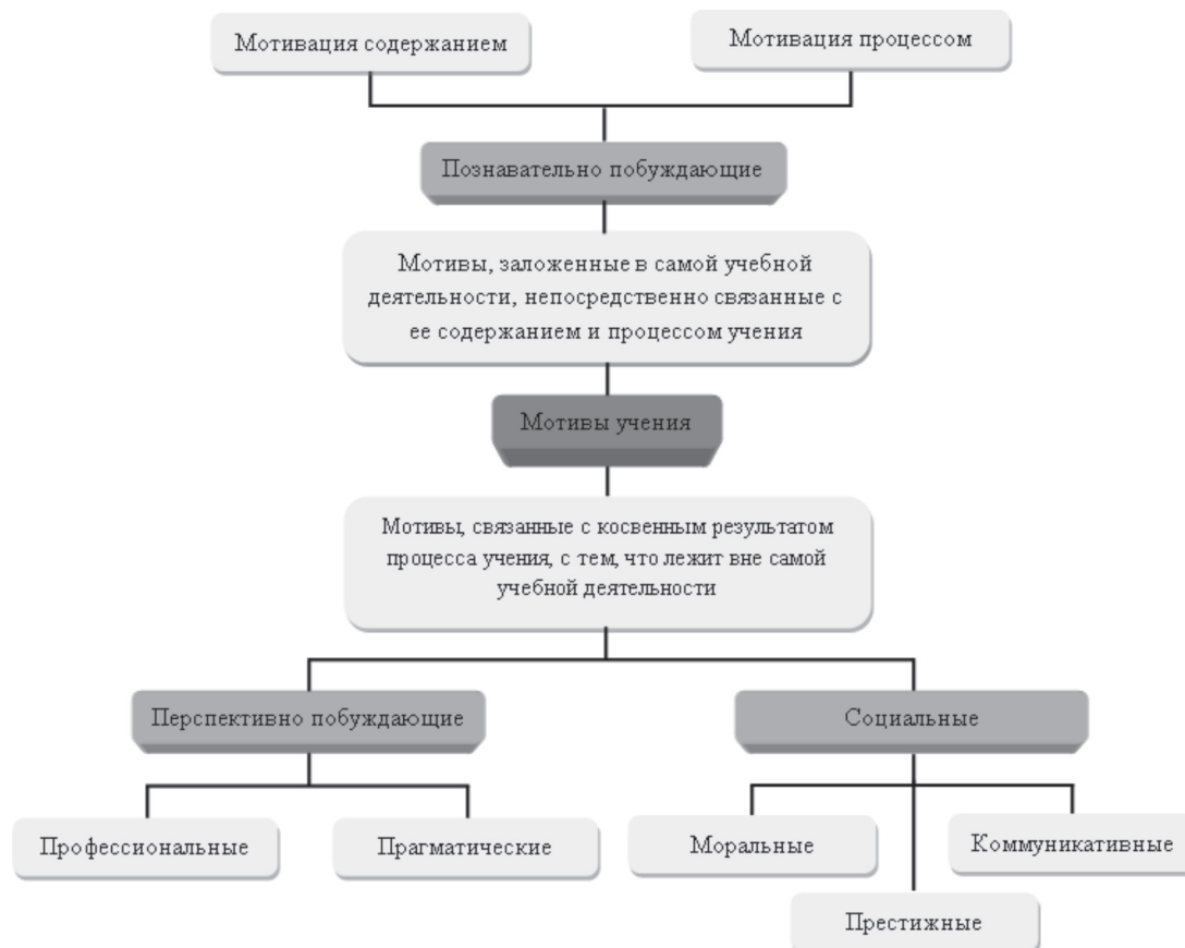
Рис. 1. Классификация мотивов учения

Следовательно, все компоненты мотивации учения взаимосвязаны и оказывают влияние друг на друга. Поэтому формирование мотивов учения не может осуществляться изолировано, не учитывая остальные компоненты мотивации учения. Только целостный подход, учитывающий все основные компоненты мотивации, может обеспечить успех в формировании и развитии истинно подлинных мотивов учения, имеющих личностно-ценностное принятие.