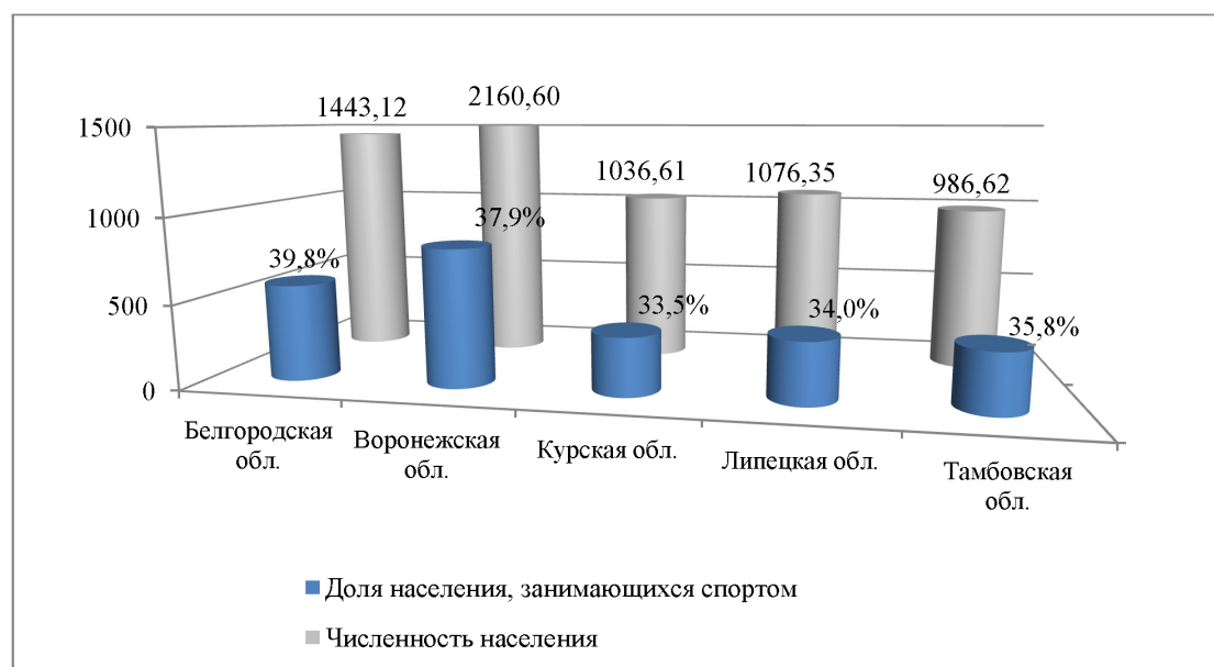
Рис. 1. Анализ доли населения, системно занимающихся спортом в 2015 г., тыс. чел.

По данным показателям наибольшую заинтересованность к активному образу жизни проявляет население Белгородской и Воронежской областей, где общее число занимающихся спортом составляет 575,03 тыс. чел. (или 39,8%) и 818,68 тыс. чел. (или 37,9%) соответственно, причем наибольшую долю среди посетителей спортсооружений занимают женщины – 42,4% и 36,8% соответственно (табл. 1).