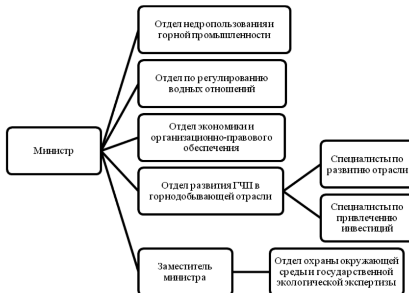
Рис. 2. Усовершенствованная структура Министерства природных ресурсов и экологии Камчатского края.