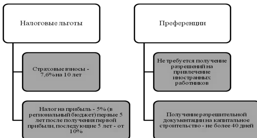
Рис. 4. Налоговые льготы и преференции в новых проектах в форме ГЧП в сфере горнодобывающей отрасли. Источник: составлено авторами

Примечание. Источник: составлено авторами.